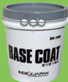
万能ベースコート