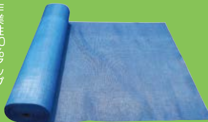
スタンダードメッシュ