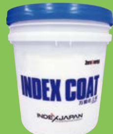
インデックスコート